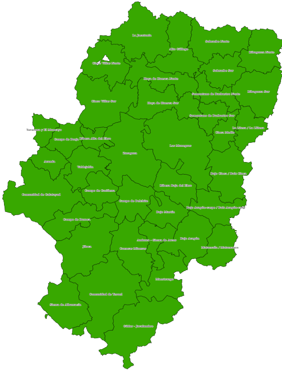
19 de marzo de 2025